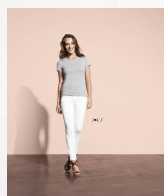
IMPERIAL WOMEN 11502