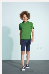
IMPERIAL KIDS 11770