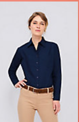
SOL'S EXECUTIVE 16060