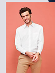
SOL'S BALTIMORE 16040