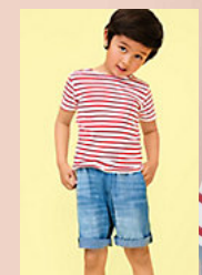
SOL'S MILES KIDS 01400