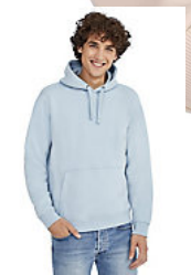
SOL'S SPENCER 02991