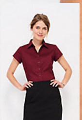
SOL'S EXCESS 17020