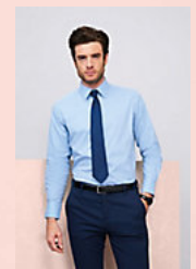
SOL'S BRIGHTON 17000