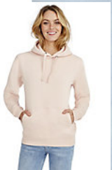
SOL'S SPENCER WOMEN 03103