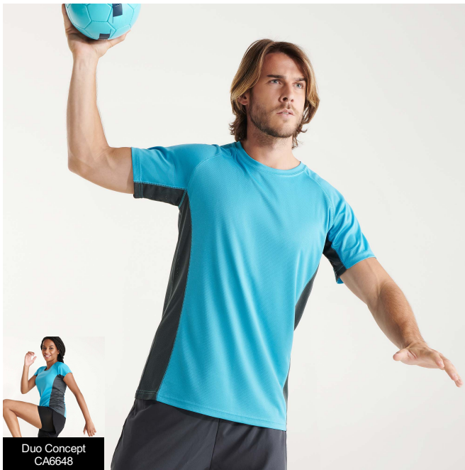
Duo Concept CA6648