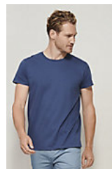
SOL'S CRUSADER MEN 03582

*Taille disponible sur certaines couleurs.