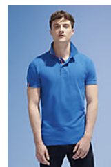
SOL'S PATRIOT 00576