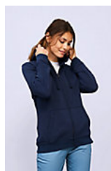
SOL'S SPIKE WOMEN 03106