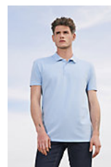
SOL'S SUMMER II 11342