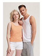
SOL'S CRUSADER TT 03980