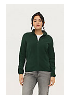
SOL'S FACTOR WOMEN