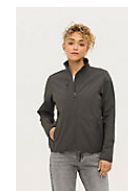
SOL'S FALCON WOMEN 03828