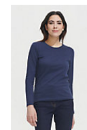
SOL'S Imperial LSL WOMEN 02075