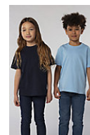
SOL'S Imperial KIDS 11770