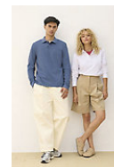
SOL'S PACIFIC LSL 04441