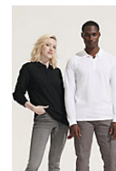
SOL'S PLANET LSL 04241