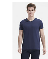
SOL'S Imperial V MEN 02940